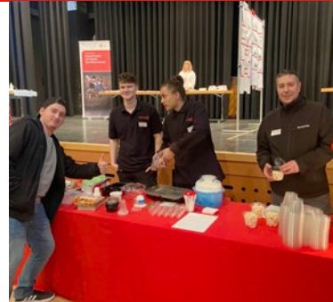
KIEFER auf Ausbildungsmesse