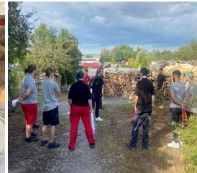
Teilnahme an Sportevents